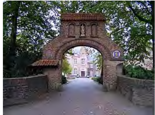
Abdij van Berne