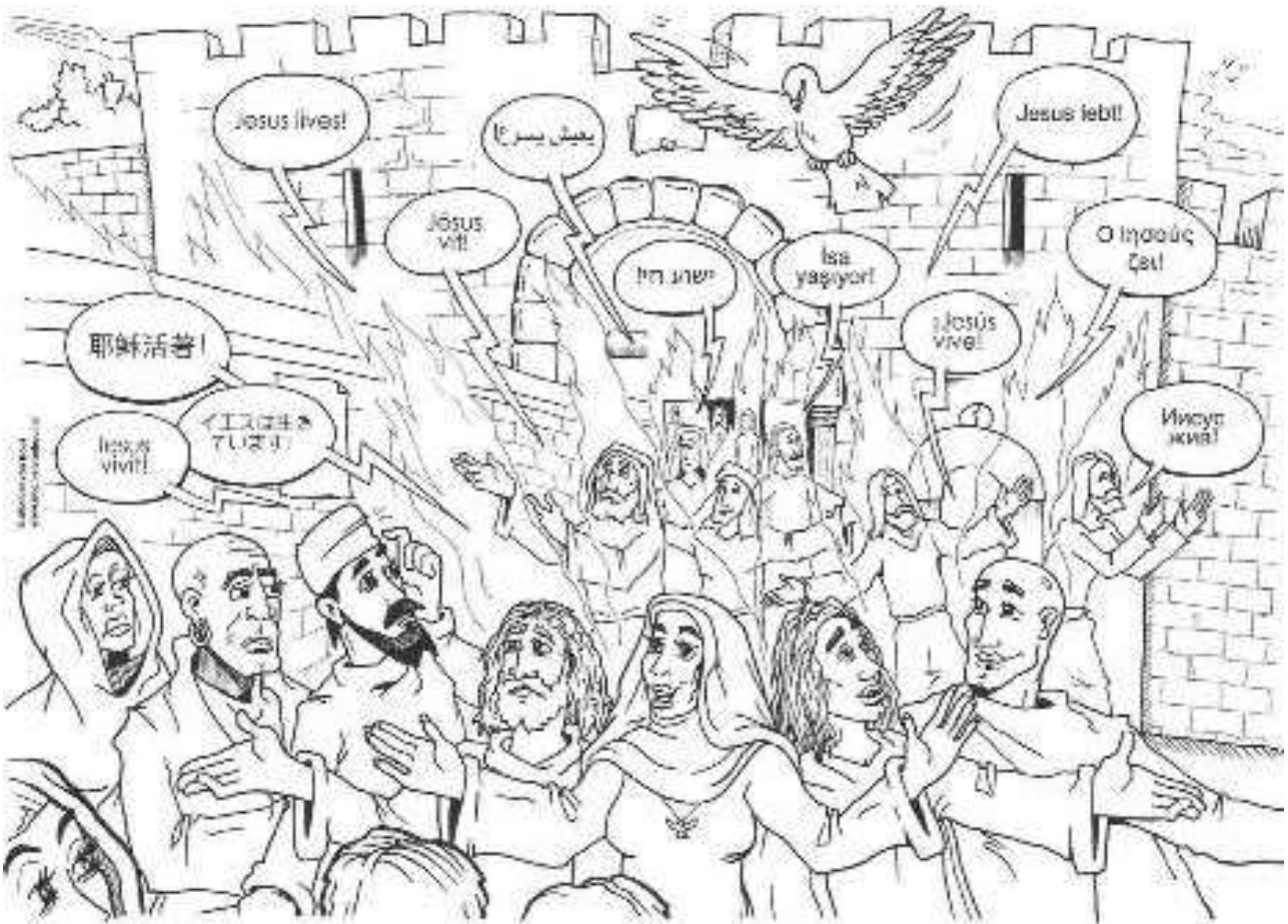
Tekening: Michiel van Hout

Maar er gebeurt nog iets heel bijzonders: zonder dat ze er voor geleerd hebben, vertellen ze hun verhaal ineens in andere talen. De mensen die luisteren, snappen het niet goed. Waarom doen de apostelen zo raar, zijn ze misschien een beetje dronken? Maar dan hoort iedereen, of-ie nu vreemdeling is of niet, het de Blijde Boodschap ineens in zijn of haar eigen taal. Des te makkelijker is deze te begrijpen!