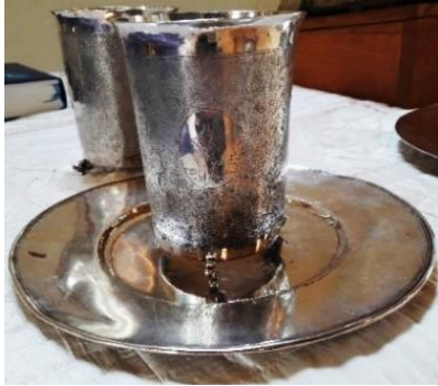
de bewuste avondmaalsbeker

Wat zou een verklaring kunnen zijn dat dit in een Protestantse kerk wordt bewaard ?