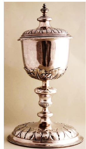
een miskelk (ciborie)

aarde de dienst – willen – uitmaken weet je het maar nooit. Maar wat kun je als eenvoudige burger ondernemen als de pleuris werkelijk uitbreekt? Niks toch? Hoe het ook zal gaan, elk adres heeft het boekje Bereid je voor op een noodsituatie ontvangen. Het staat vol met handige tips voor als er zo'n noodsituatie uitbreekt. Aan het begin worden