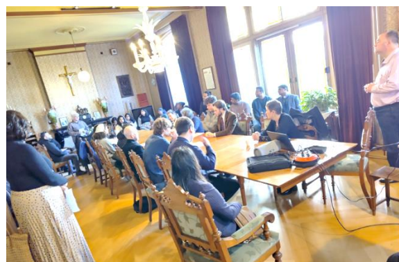
Veel enthousiaste deelnemers bij het vervolgprogramma

Na afloop werd het programma voortgezet in de pastoriezaal. Eerst keken we met elkaar naar een filmpje dat aansloot op het thema "Op weg naar het Licht." Aan de hand daarvan werden in groepjes verschillende geloofsvragen met elkaar besproken.