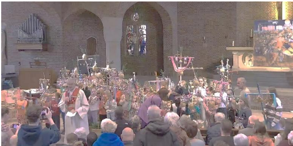
St. Petrus Krommenie

In onze parochies is ook dit jaar weer met veel enthousiasme gewerkt aan de Palmpasenstokken voor de Palmpaasprocessie in de vieringen op Palmzondag. Op de foto's tonen de kinderen en jongeren hun prachtig versierde stokken.