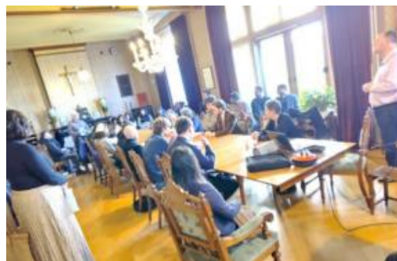
Veel enthousiaste deelnemers bij het vervolgprogramma

Na afloop werd het programma voortgezet in de pastoriezaal. Eerst keken we met elkaar naar een filmpje dat aansloot op het thema "Op weg naar het Licht." Aan de hand daarvan werden in groepjes verschillende geloofsvragen met elkaar besproken.