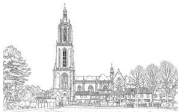
Matthé Bruijns en Ko Schuurmans

In het volgende parochieblad dat voor de grote vakantie verschijnt vindt u meer informatie en kunt u zich ook aanmelden.