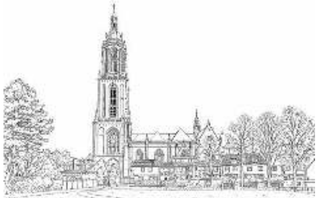
Matthé Bruijns en Ko Schuurmans

In het volgende parochieblad dat voor de grote vakantie verschijnt vindt u meer informatie en kunt u zich ook aanmelden.