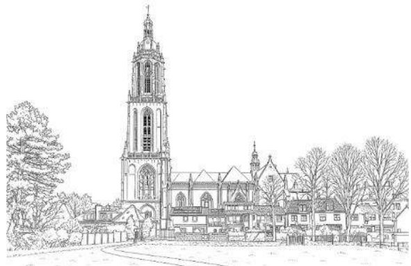
Matthé Bruijns en Ko Schuurmans

In het volgende parochieblad dat voor de grote vakantie verschijnt vindt u meer informatie en kunt u zich ook aanmelden.