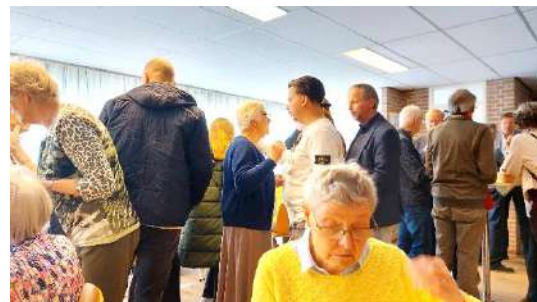
Na de viering in de bovenzaal

De handen ineen geslagen en met dezelfde positieve instelling van mensen wordt met elkaar het hart van een organisatie genoemd.