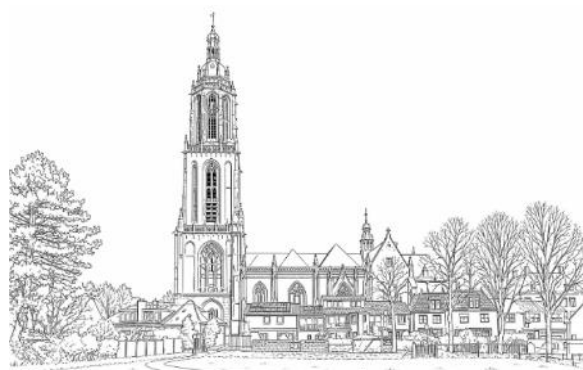
Matthé Bruijns en Ko Schuurmans

In het volgende parochieblad dat voor de grote vakantie verschijnt vindt u meer informatie en kunt u zich ook aanmelden.